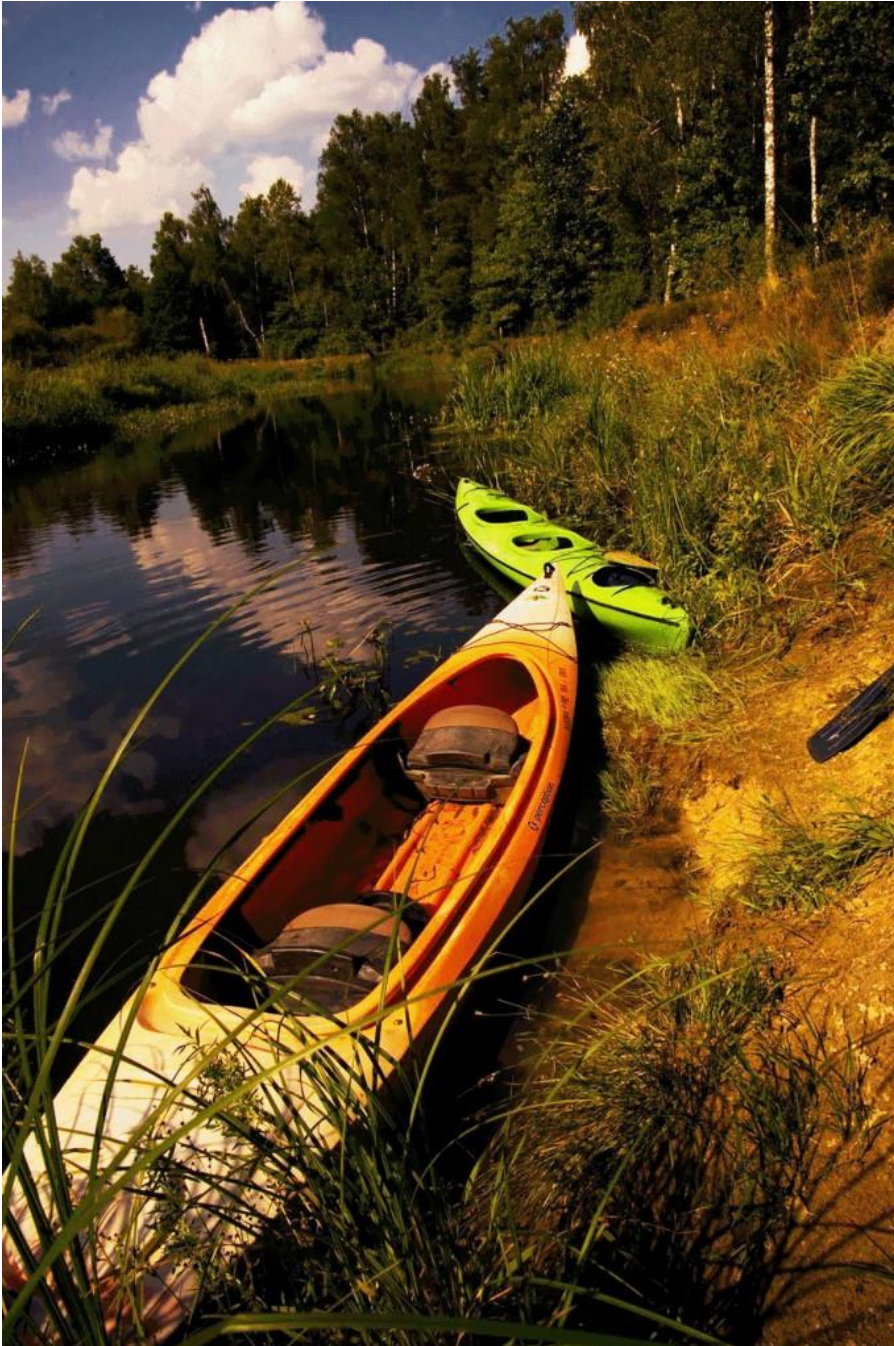
Kanus auf der Beresina