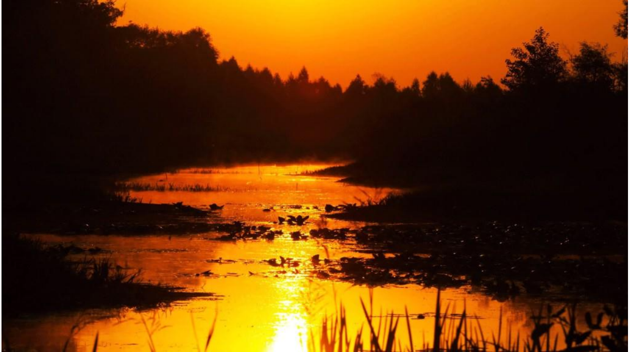
Abenddämmerung über der Beresina

einer der unberührtesten. Die Beresina wartet mit einem zickzackförmigen Flussbett, mit viel Altwasser und Flutseen, und einer großen Vielfalt an Flora und Fauna auf. Die bewachsenen Altwasser schaffen perfekte Lebensbedingungen für viele Vögel und Wassersäugetiere wie Biber und Otter. Während der Tour sind ihre Spuren überall zu entdecken, mit etwas Glück zeigen sich die Tiere auch.